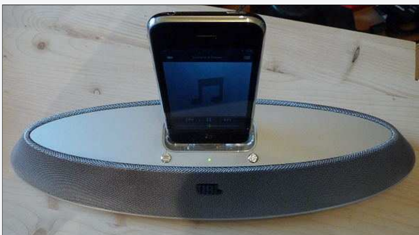
JBLs On Stage kommt mit allen Musikstilen gut zurecht

Mit Pegeln oberhalb der Zimmerlautstärke jedoch kommt das Sounddock problemlos zurecht, und für Disco-ähnliche Pegel ist es auch nicht gemacht. Die akustische Detaillierung ist überraschend gut, wie sich sogar beim komplex zu handhabenden "My Way" in der Interpretation des neuen Stars am Tenor-Himmel Paul Potts herausstellt. Potts beeindruckende Stimme ertönt keinesfalls monoton und oberflächlich, sondern überraschend tief Sinnig und facettenreich. Natürlich darf man nicht enorme Brillanz oder charismatische vokale Ausprägung erwarten - schließlich handelt es sich nicht um ein vollwertiges Stereosystem, sondern um ein kompaktes Sounddock für iPhone und iPod. Und in Anbetracht dieses Bestimmungszweckes macht das On Stage einen hervorragenden Job - wie gut die Bühne zu Beginn von "The Power of Love" von Jennifer Rush umrissen wird, ist in Anbetracht eines so kompakt bauenden Lautsprechersystems enorm. Die Stimme klingt klar und souverän - für einen Kaufpreis von knapp 180 EUR überragend. Auch beim Tanzschulen-Discofox-Klassiker "Love Pains" begeisterte uns die frische, mitreißende Wiedergabe, das On Stage hat mit dem flotten Beat keinerlei Probleme, sondern hat noch genug Ressourcen, um Minellis vokale Präsenz gut einzuarbeiten.