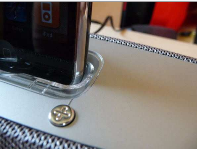
Das iPhone 3G steht recht fest im dafür vorgesehenen Docking-Einsatz