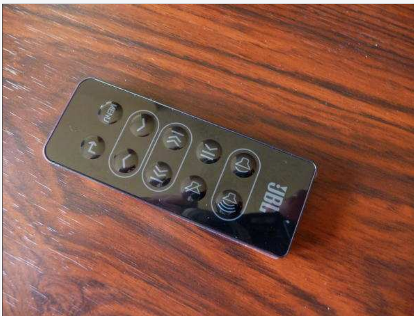
Einfache Bedienung mittels der Fernbedienung

Geeignet ist die On Stage 200ID für alle Docking-fähigen iPods, so für den nano G3, iPod Classic, iPod Touch und iPhone. Zudem ist eine 3,5 mm Miniklinkenbuchse vorhanden, an die man andere externe MP3-/Mediaplayer anschließen kann. Diese kann man zwar nicht über die Fernbedienung des On Stage steuern, die Funktion als klangstarkes Lautsprechersystem jedoch wird auch hier erfüllt. JBL gibt eine Ausgangsleistung von 2 x 10 Watt an, als Magneten in den Treibern fungieren besonders kraftvolle Neodym-Bauteile. Als Frequenzgang werden 40 bis 20.000 Hz genannt. Der Signal-Rauschabstand des 0,7 kg wiegenden iPod-Soundsystems liegt bei 85 dB. Das mitgelieferte Multi-Voltage-Netzteil (110 - 240 V AC) ist relativ kompakt und nicht so unförmig wie bei manchem Konkurrenten. Leider gibt es keine Möglichkeit, das On Stage 200ID mit Akkus zu betreiben. Gesamtnote in Relation zur Preisklasse: Sehr gut - ausgezeichnet.