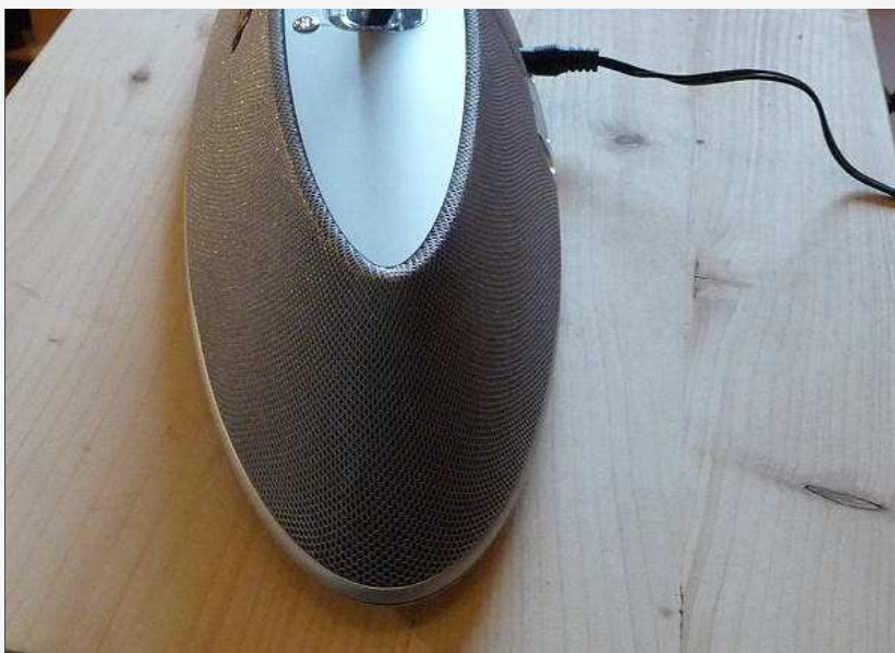
Erstaunlich räumlicher Klang

Stage 200ID auch die tieffrequenten Anteile kennen, die andere Systeme dieser Art gern verschweigen. Auch bei "Always", einem der letzten großen Hits des Pop-Duos Erasure (1994 wurde der Song ein Erfolg), überzeugt das JBL-System mit klarem, raumfüllenden Klang. Nur sehr hohe Pegel auf längere Zeit mag das On Stage nicht so gern, dann senkt es automatisch die gehörte Lautstärke und bei vollem Basseinsatz wird merklich komprimiert, den Stimmen wird ebenfalls Dynamik und Klarheit genommen.