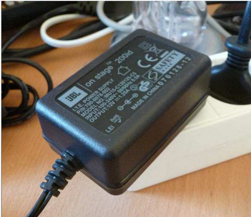
Mitgeliefertes Netzteil mit noch akzeptablen Abmessungen