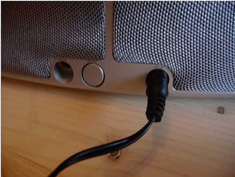
3,5 mm Miniklinkenanschluss, Netzschalter und der Anschluss fürs externe Netzteil befinden sich auf der Rückseite